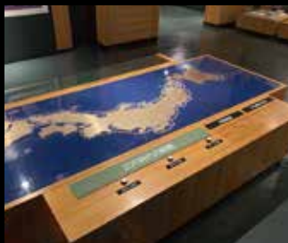
江戸時代の北前航路