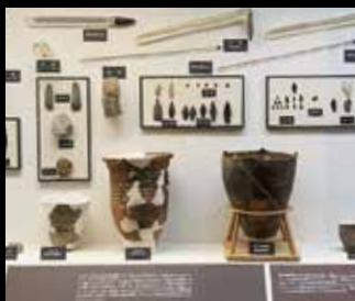
留萌から出土された土器