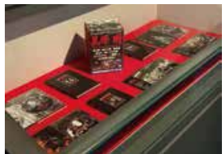
映画音楽の代表作品

1928年5月29日6人兄弟の末っ子として生まれ、国立音楽大学卒業後、早坂文雄(映画七人の侍等)に師事。以後、黒澤明作品をはじめ、生涯担当した映画作品は全308本、美空ひばり「一本のえんぴつ」などの歌謡曲やドラマ「若者たち」の主題歌(1966年放送)は多くの人達に親しみ続けられている。「北の序曲」「留萌の海へ」といったオリジナル作品も残し、故郷への温かいまなざしがうかがえる。各映画、音楽賞など受賞歴多数。紫綬褒章、勲四等旭日小綬章も賜る。平成4年留萌市功労者として表彰。