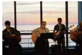
1F ロビー コンサート