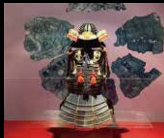
星かぶとと胴丸鎧 (複製)