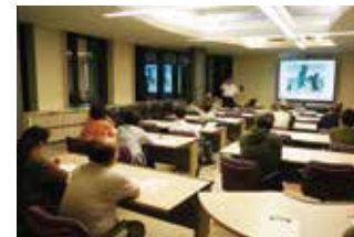
2F 会議室 勉強会