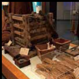
当時使われたニシン漁具