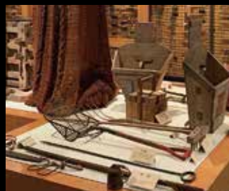
明治・大正近代のニシン