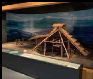
縄文時代の三泊地区 (ジオラマ)