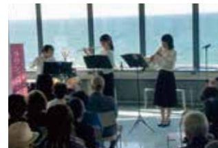
2F 展望ラウンジ コンサート