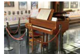
作曲に使われたピアノ