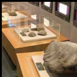
留萌近郊で出土された化石