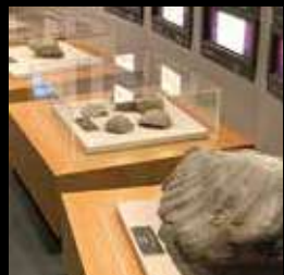
留萌近郊で出土された化石