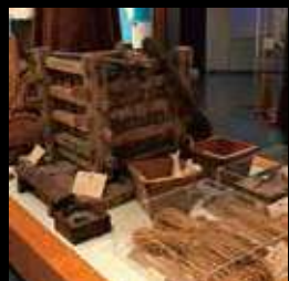
当時使われたニシン漁具