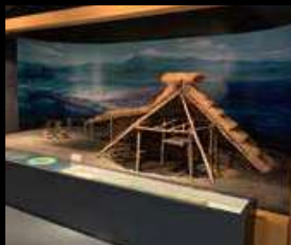
縄文時代の三泊地区（ジオラマ）