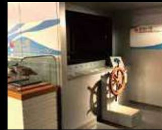
るもい号 留萌港内遊覧シミュレーション