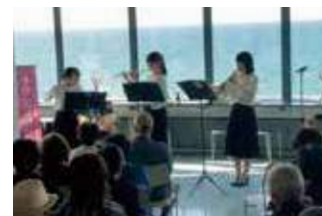
2F 展望ラウンジ コンサート