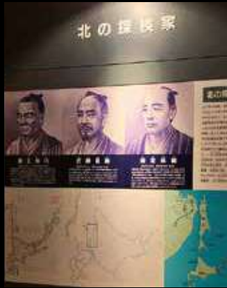
江戸時代の北の探検家