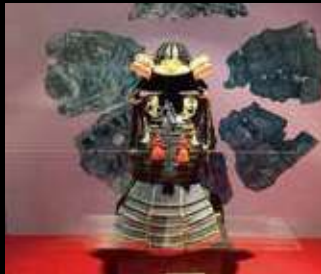
星かぶとと胴丸鎧（複製）