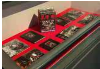
映画音楽の代表作品

各映画、音楽賞など受賞歴多数。紫綬褒章、勲四等旭日小綬章も賜る。平成4年留萌市功労者として表彰。