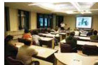
2F 会議室 勉強会