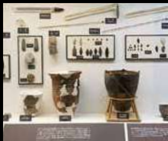
留萌から出土された土器