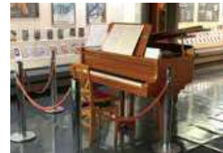
作曲に使われたピアノ