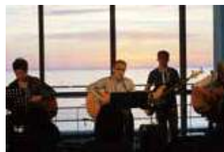
1F ロビー コンサート