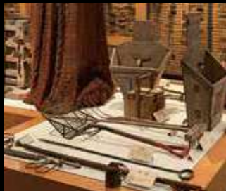
明治・大正近代のニシン