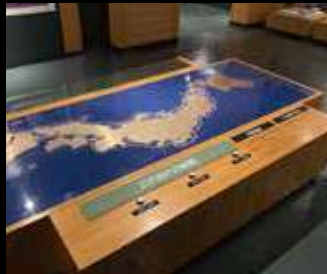
江戸時代の北前航路